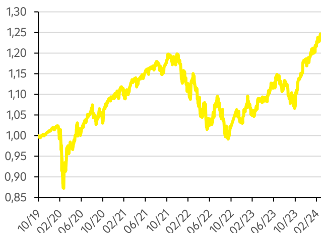
Vývoj hodnoty fondu FWR Strategy 30 USD